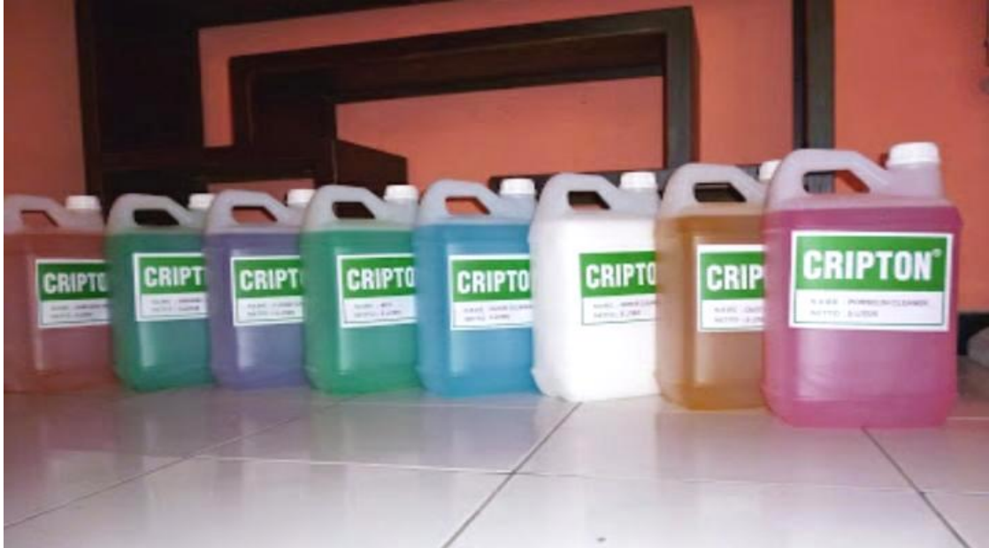
Lampiran 2 :