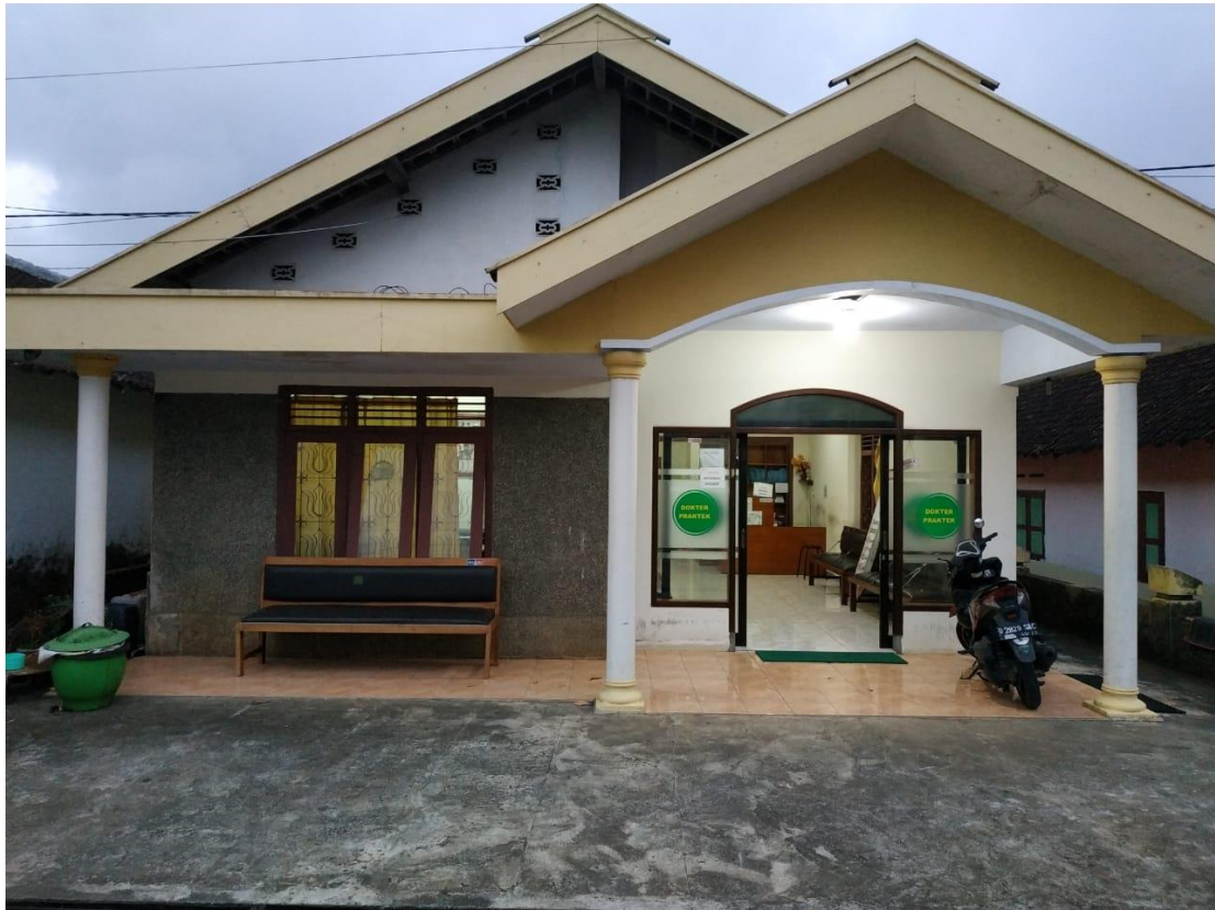
Lampiran 4. Bangunan Klinik