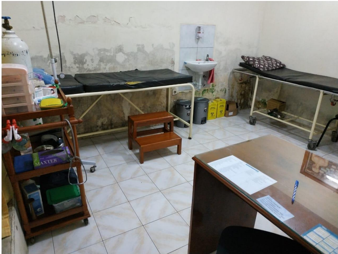
Lampiran 7. Ruang Pemeriksaan Dan Perawatan