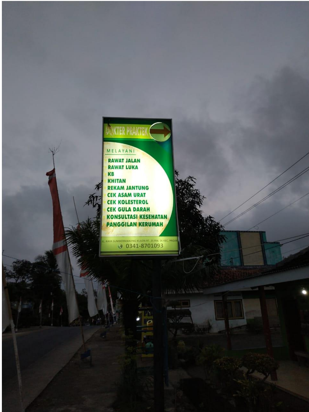
Lampiran 5. Papan Reklame Klinik