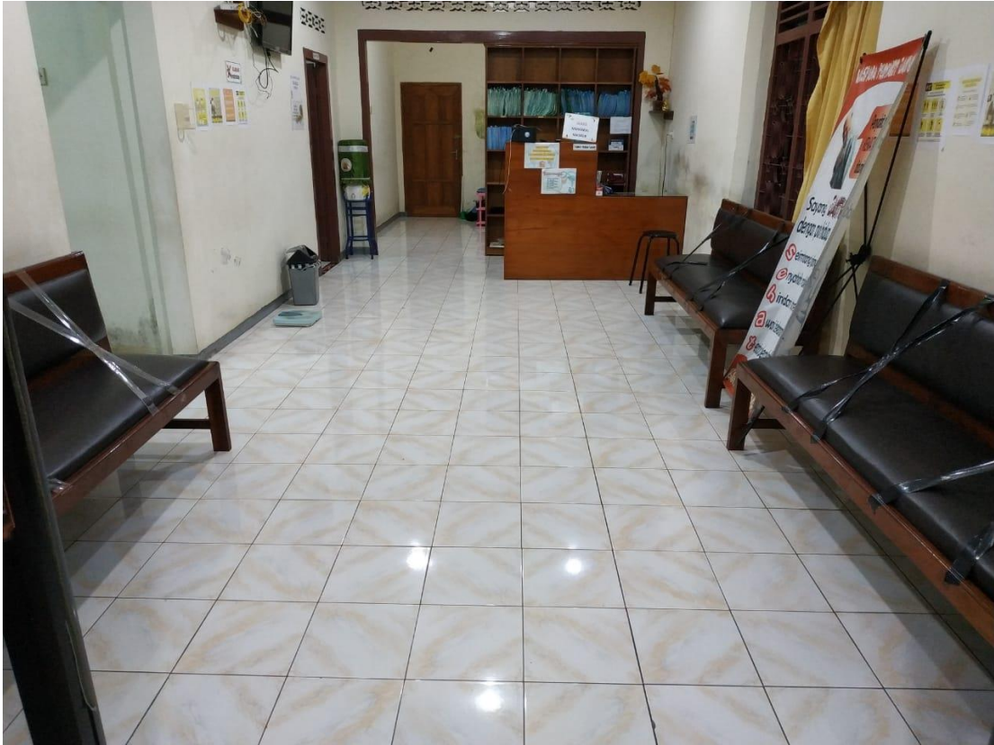
Lampiran 6. Ruang Tunggu Klinik