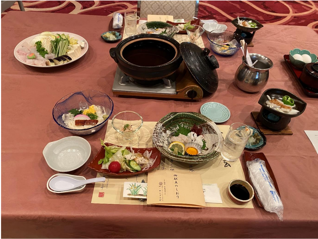
Foto 1. 2 Setting Hidangan Ikan Buntal Harimau Awaji tahun ke-3