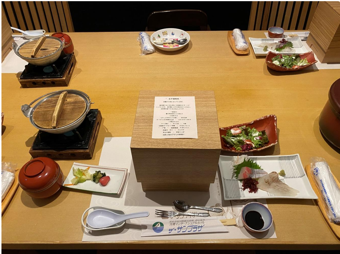
Foto 1. 3 Setting Menu Pagi