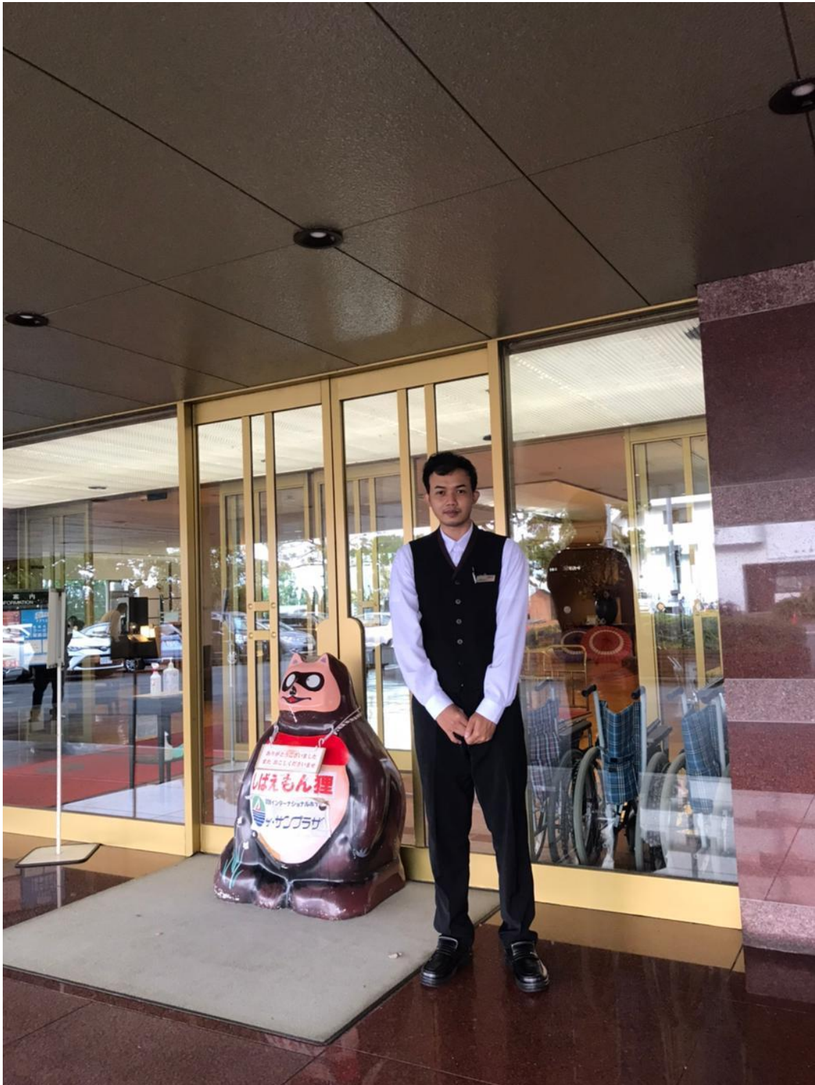
Foto 1. 1 Di depan Hotel Sun plaza