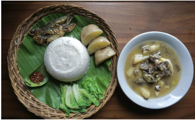
Nasi Aron dan Kondimen Lauk