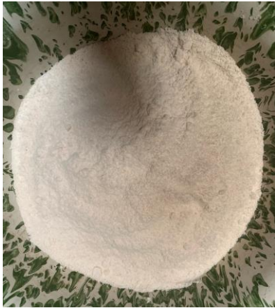
Tepung Jagung Kasar