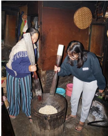
Jagung Di Tumbuk / Di kecross