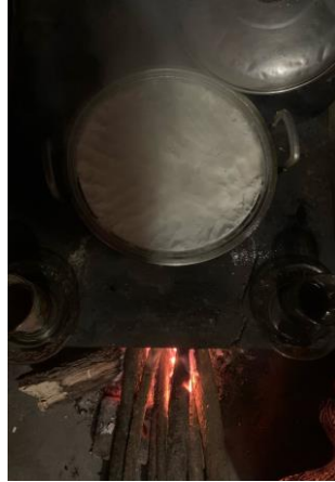
Di Masak Di Atas Tunggu