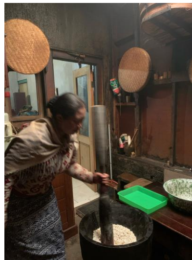
Jagung Di Tumbuk Kembali