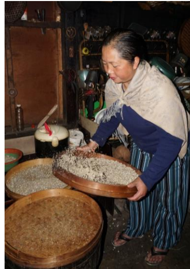
Jagung Di Tapeni / Menapi