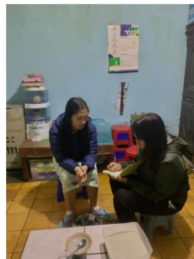
Konsumen 3 (M.Mega)