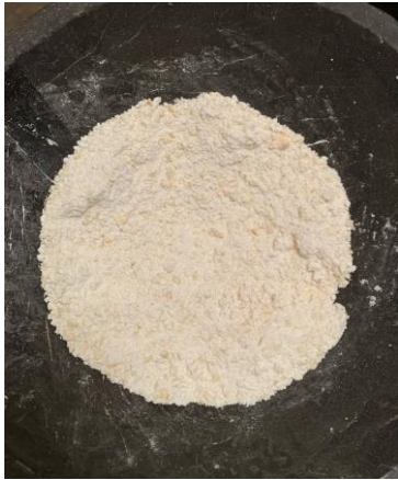
Tepung Jagung Kasar