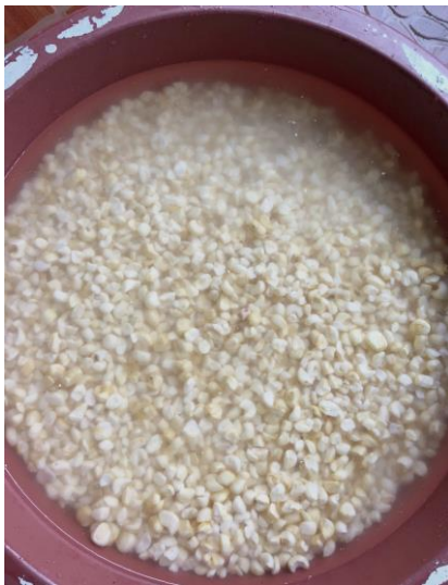
Jagung Di Rendam