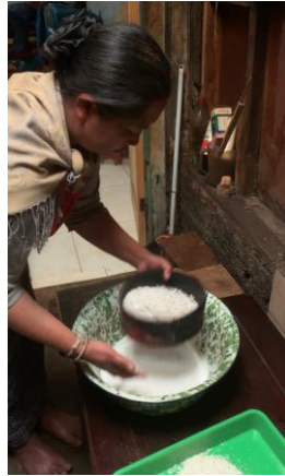
Di Irik'i / Di Ayak