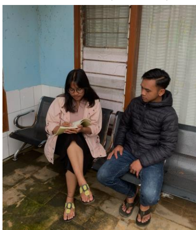
Konsumen 4 (Mas Dana)