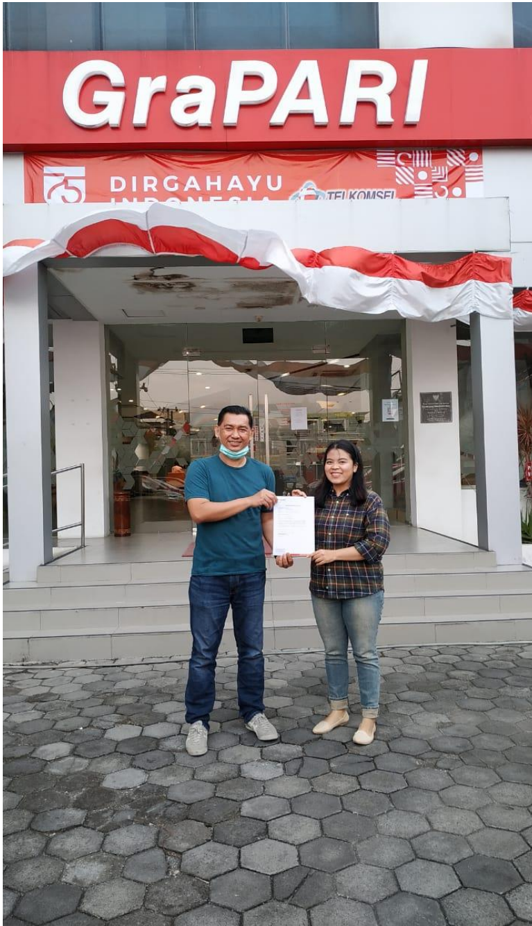
Lampiran 2-Gambar Objek Penelitian